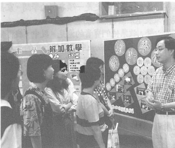
學校開放日：家長團參觀專室