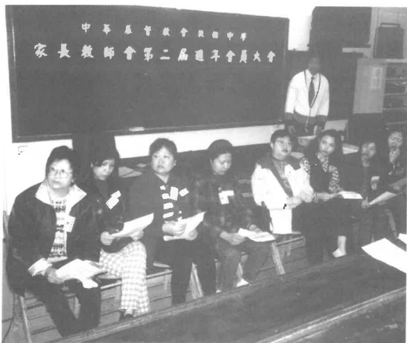
第二屆週年會員大會