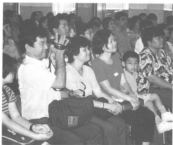
家長出席學校懇親會