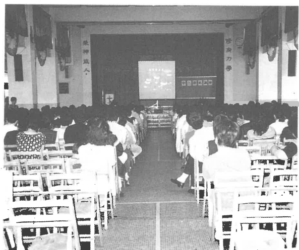
家長出席中一學生升中二選科講座